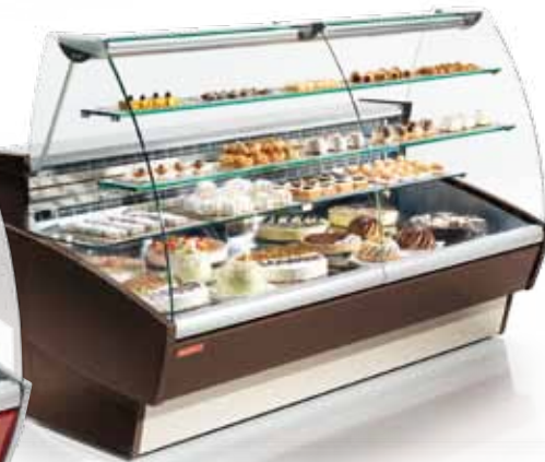
Sweet 2 Brown